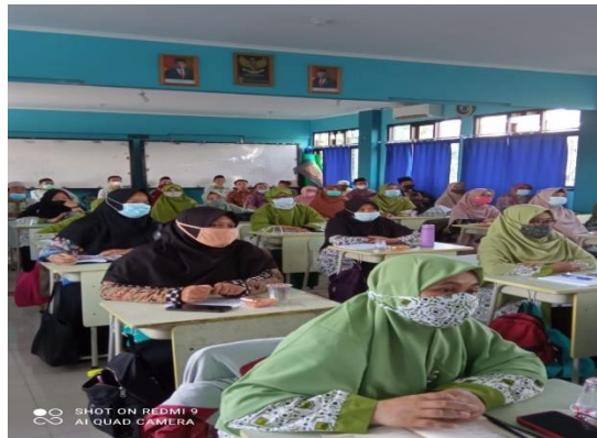
Gambar 2, Dokumentasi Pelatihan

Keterampilan berbahasa banyak berdampak pada kehidupan sehari-hari anggota dari setiap ras, keyakinan, dan wilayah di dunia. Bahasa membantu mengekspresikan perasaan, keinginan, dan pertanyaan kita kepada dunia di sekitar kita. Kata-kata, gerak tubuh, dan nada digunakan secara bersatu untuk menggambarkan spektrum emosi yang luas. Metode unik dan beragam yang dapat digunakan manusia untuk berkomunikasi melalui bahasa tertulis dan lisan.