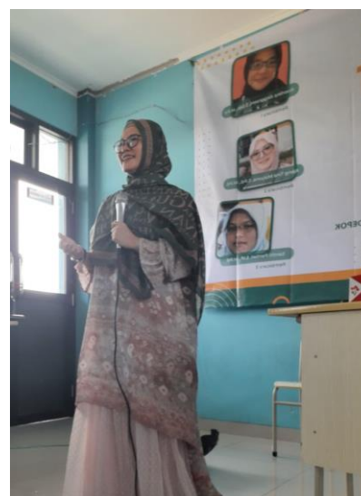
Gambar 3. Pemberian Materi Komuniask Bahasa Indonesia dan Bahasa Inggris Bagi Guru Yayasan Pendidikan RUHAMA

Komunikasi merujuk pada bagaimana orang saling berbagi pandangan dan pikiran dengan orang lain. Cara efektif berkomunikasi, misalnya membaca, menulis, berbicara, dan lain sebagainya. Komunikasi sendiri memiliki manfaat dalam segala bidang. Tak hanya itu, kemampuan berkomunikasi yang baik juga dapat mengubah hidup seseorang. Komunikasi yang baik menjamin adanya pertukaran pikiran dan pandangan yang benar sehingga tidak terjadi kebingungan. Jika sebuah hal tidak dikomunikasikan dengan baik, maka orang akan