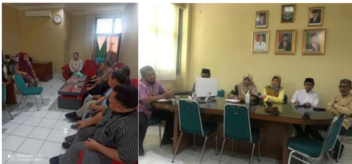
Gambar 4. Kunjungan pada Mitra untuk Penjajakan Kegiatan

Kegiatan selanjutnya adalah mengunjungi mitra untuk menentukan kebutuhan mitra dan menentukan tanggal dan waktu pelaksanaan pelatihan. Kegiatan kunjungan mitra ini dilakukan tanggal 23 Februari 2024.