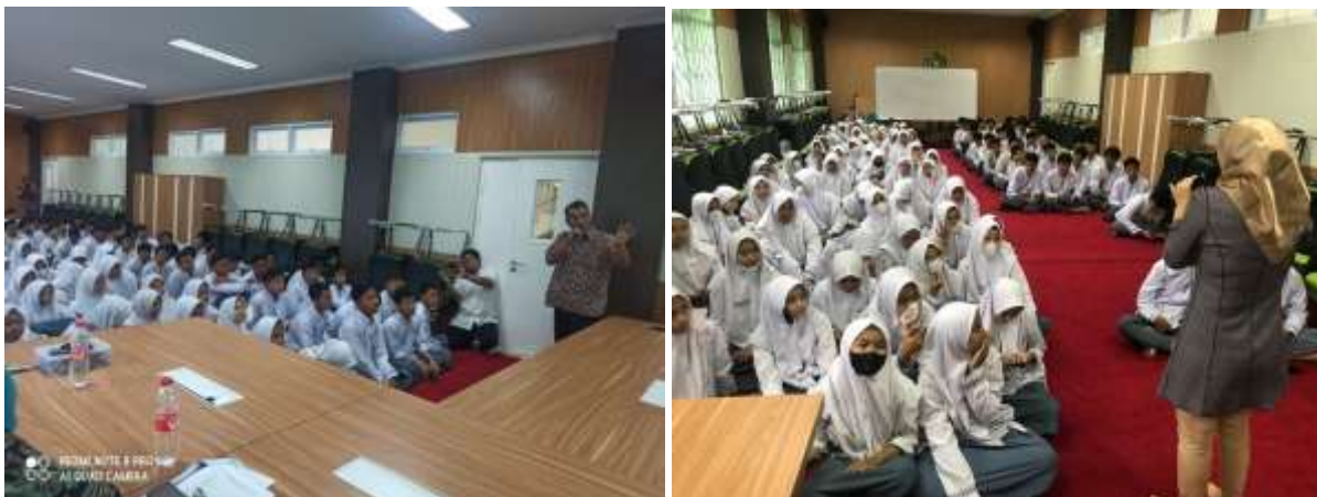
Gambar 4. Tahap Pelaksanaan Pelatihan

Materi berikutnya adalah bagaimana melakukan investasi skala kecil antra lain melalui pasar modal.