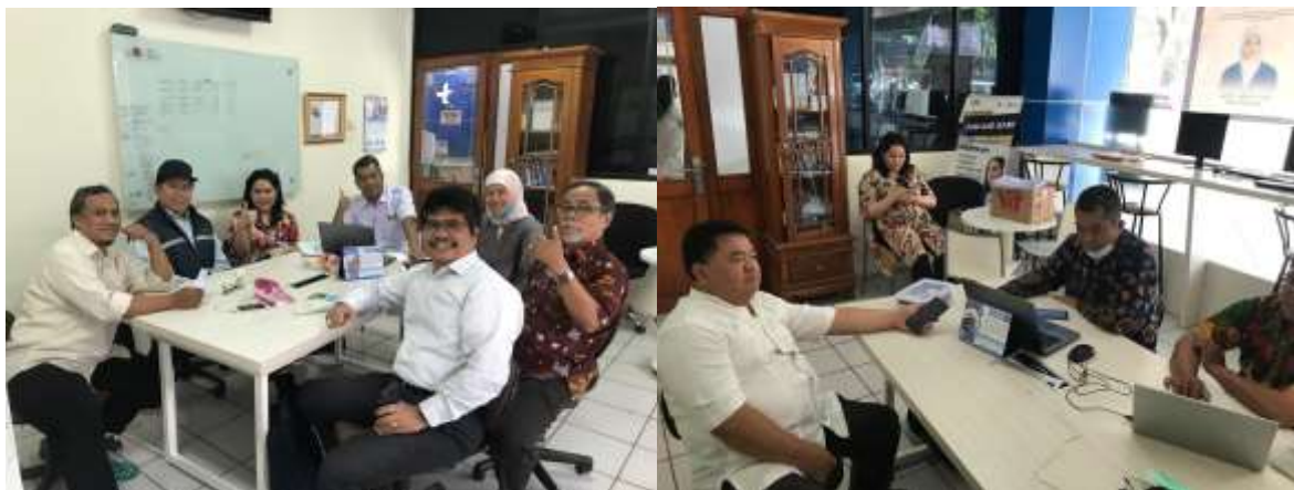
Gambar 3. Rapat Persiapan Pelaksanaan Kegiatan Pengmas

Kegiatan selanjutnya adalah mengunjungi mitra untuk menentukan kebutuhan mitra dan menentukan tanggal dan waktu pelaksanaan pelatihan. Kegiatan kunjungan mitra ini dilakukan tanggal 23 Februari 2024.